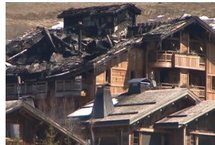
Les toits du Four Seasons

Nous vous recommandons, au-delà de « casser » les feux avant de quitter la pièce, de veiller à ne pas laisser des braises dans la cheminée et de bien effectuer les ramonages annuels. Cela est d'autant plus vrai que vous ne résidez pas à Megève en permanence. Beaucoup d'entre nous oublient parfois cette obligation légale indispensable pour répondre aux demandes de votre assurance en cas de sinistre.