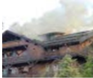
Le Fer à cheval

La loi des séries ? La malchance ? Après le Four Seasons , c'est au tour d'un autre palace de Megève Le Fer à Cheval d'être victime d'un incendie.